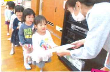
おとしまありがとうございます！

・お正月あそびでは、手回しごまや、福笑い、はねつき、かるた等様々な遊びをして楽しんでいきます。「初めてやる」という子も多く、興味深々で難しいながらも練習して楽しんでいましたよ！園長先生からのお年玉を開けて、「はやく凧やりたい！」「おうちで晴れてからやる！」と意気込む子ども達です♪