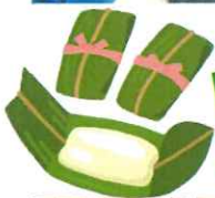
ムーチャービーサー♪ いいにおいで、おいしい！