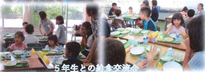
5年生との給食交流会

《子どもたちの気づき》 ☆授業を真剣に聞いていた ☆授業の始まりの挨拶が面白かった。 ☆お兄ちゃんお姉ちゃんが優しい。 ☆机やイスが大きかった ☆なんでもたくさん食べてかっこいい ☆ごはん中も背筋がピンとしていた！