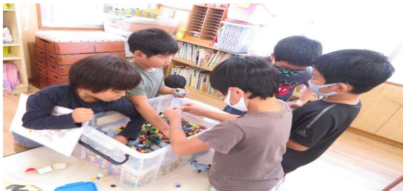
そら、たいよう組さんと一緒にラキューで遊んでる3年生男子チーム♪

女の子は小さい赤ちゃんLOVEが伝わり、何回でも行きたいと叫んでいました♪上手に抱っこも出来るし、ミルクをあげる事も上手でした。さすがお姉ちゃんだなと感じさせられました(*^▽^*)小さい子の気持ちは汲み取り一緒にママごと等も遊んでくれて楽しかったと喜んでいました♡