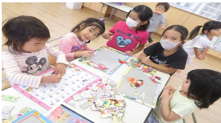
うみ組さんの女の子チームと一緒にパズルしてる3年生チーム☆